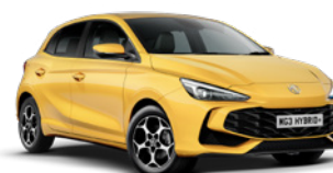
ŻÓŁTY „PASTEL YELLOW” (standard)

* Lakier trójwarstwowy i metaliczny dostępne za dodatkową opłatą.