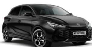
CZARNY „PEBBLE BLACK” (metalik)