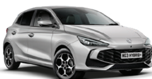
SREBRNY „COSMIC SILVER” (metalik)