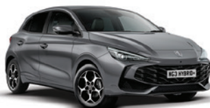
SZARY „HAMPSTEAD GREY” (metalik)