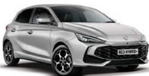
SREBRNY „COSMIC SILVER” (metalik)