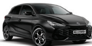
CZARNY „PEBBLE BLACK” (metalik)