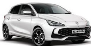
BIAŁY „DOVER WHITE” (standard)