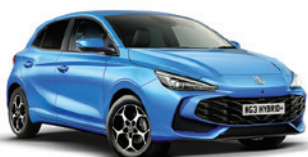
NIEBIESKI „COMO BLUE” (metalik)

Przygotuj się na to, że będziesz przyciągać uwagę.