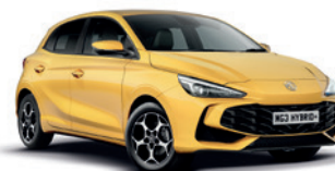
ŻÓŁTY „PASTEL YELLOW” (standard)

* Lakier trójwarstwowy i metaliczny dostępne za dodatkową opłatą.