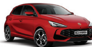
CZERWONY „DIAMOND RED” (trójwarstwowy)