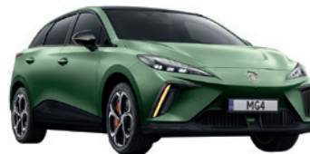
● Zielony „Hunter Green” matowy