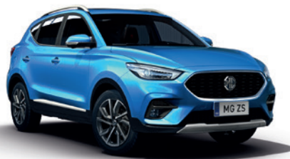
Niebieski „Battersea Blue” (metalik)