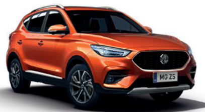
Pomarańczowy „Hoxton Orange” (metalik)