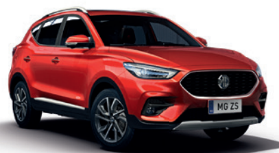
Czerwony „Dynamic Red” (trójwarstwowy)

Prezentowany model jest przykładowy i może mieć wyposażenie dodatkowe.