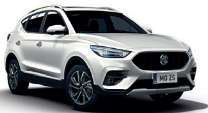
Biały „Arctic White” standard