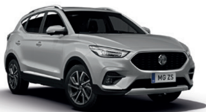
Srebrny „Monument Silver” (metalik)