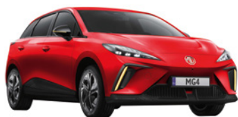
● Czerwony „Diamond Red” trójwarstwowy