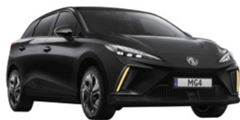
● Czarny „Pebble Black” metalik

Wybierz wariant wyposażenia: Standard, Comfort, Luxury, Luxury Long-Range, XPOWER, i przyciągaj spojrzenia, gdziekolwiek pojedziesz.