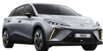
● Srebrny „Medal Silver” metalik