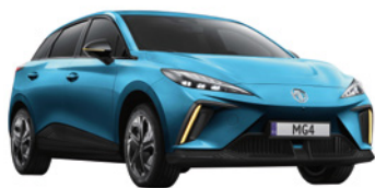
● Niebieski „Brighton Blue” standard