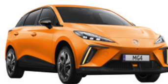
● Pomarańczowy „Fizzy Orange” trójwarstwowy