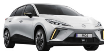
○ Biały „Dover White” standard