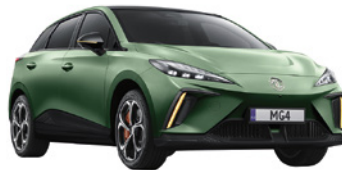
● Zielony „Hunter Green” matowy