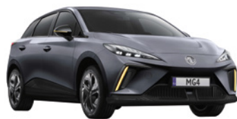
● Szary „Andes Grey” metalik