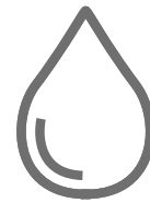
Zużycie paliwa 7,4-7,7 l/100 km