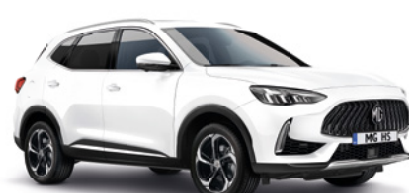
Biały „Dover White” (standard)