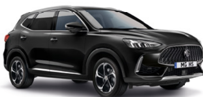
Czarny „Pebble Black” (metalik)