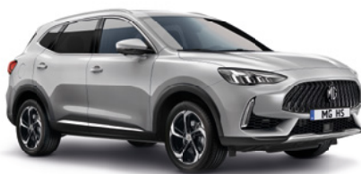
Srebrny „Medal Silver” (metalik)