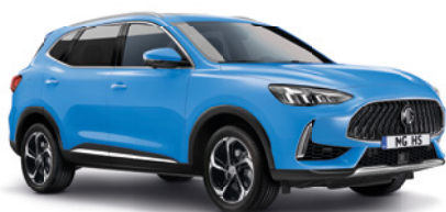
Niebieski „Brighton Blue” (standard)