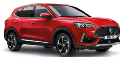
Czerwony „Phantom Red” (trójwarstwowy)