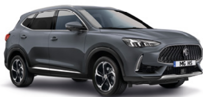
Szary „Magic Grey” (metalik)

Wybierz wariant wyposażenia: Standard, Excite, Exclusive, i przyciągaj spojrzenia, gdziekolwiek pojedziesz.